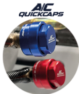
Tapa válvula de aluminio 100% herméticas

Panel de control con pantalla LCD de monitoreo